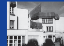
Akademie f. Tonkunst